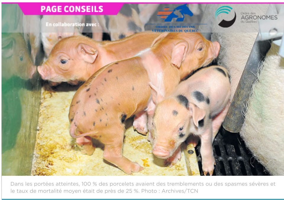
Dans les portées atteintes, 100 % des porcelets avaient des tremblements ou des spasmes sévères et le taux de mortalité moyen était de près de 25 %.