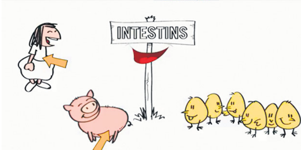
Image tirée de la vidéo intitulée Les alternatives qui mijotent au labo : Ce que les chercheurs vous concoctent!