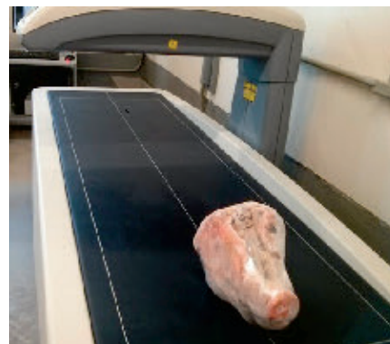
Numérisation d'une tête de porc permettant d'évaluer la minéralisation d'un élevage ou d'une stratégie d'alimentation

Agri-Marché, le Groupe Cérès, Jefe Nutrition et Olymel sont quelques-unes des entreprises ayant déjà eu recours à l'outil, démontrant ainsi son utilité et sa pertinence.