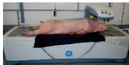
Numérisation d'un porcelet vivant permettant d'estimer le contenu en muscle (protéines), en gras (lipides) et en minéraux.