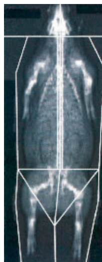
Image résultant de la numérisation d'un porc vivant

Quelques domaines de recherche ayant eu recours au DXA au Québec