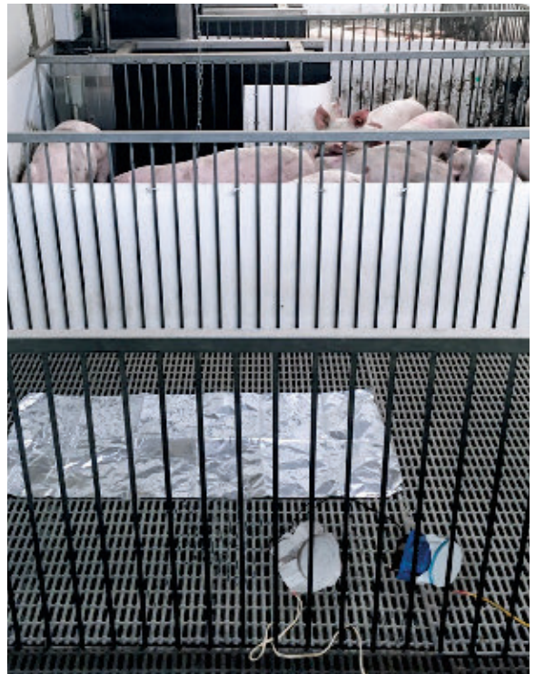
Récolte des aérosols et poussières avec deux XFAN et une feuille d'aluminium dans un parc près des porcs

Les résultats de cette première phase suggéraient que les techniques de collectes d'aérosols avec les deux outils du CDPQ (XFAN et ALU) permettaient de détecter la présence du vSRRP. Les tests réalisés sur les mouches et les souris suggéraient que ce sont de piètres moyens de transport du virus. Finalement, la collecte de matériel biologique sur les divers équipements de ferme et les outils potentiellement contaminés n'ont pas permis de révéler la présence de grande quantité de virus.