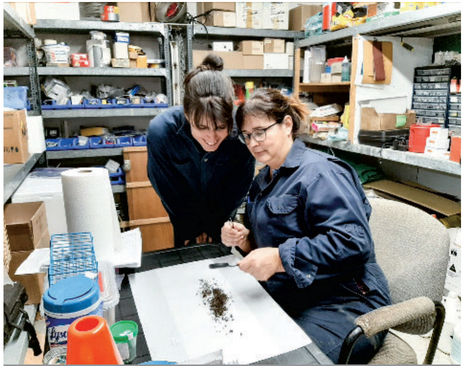
Identification et classification des mouches récoltées dans la ferme.

En conclusion, ce projet de recherche a permis de montrer qu'il est possible de trouver du vSRRP dans l'environnement des porcins par la collecte et l'analyse des poussières et des aérosols prélevés à proximité des animaux contaminés (< 2 m). Ces travaux, réalisés à la station de recherche du CDPQ, suggèrent que les deux techniques de prélèvement des aérosols (ALU et XFAN), conçus par l'équipe du CDPQ, pourraient probablement être utilisées comme méthode d'échantillonnage pour identifier la présence du vSRRP et potentiellement d'autres virus, tels que l'influenza, dans les fermes commerciales du Québec. ■